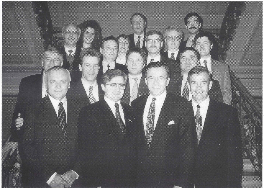
Делегация провінції Канади Манітоба на чолі з прем'єром Гері Филмоном зустрічаються з працівниками Посольства Канади в Україні

У першому тижні жовтня ц.р. відбувся візит прем'єра канадської провінції Манітоба Гері Филмона в Україну. Його метою було сприяти манітобським підприємствам у виході на міжнародний ринок, налагодити роботу спільних підприємств в Канаді й Україні. Делегація відвідала Київ та Львів — місто-побратим Вінніпегу, столиці Манітоби.