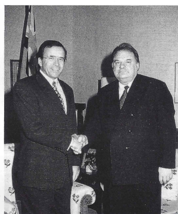
Прем'єр Манітоби Гері Філмон та Геннадій Удовенко