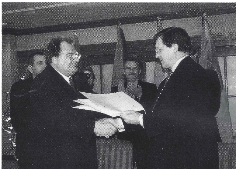
Міністри закордонних справ Канади і України Ллойд Аксворті і Геннадій Удовенко при підписанні договорів у Вінніпезі 6 березня 1997 р.