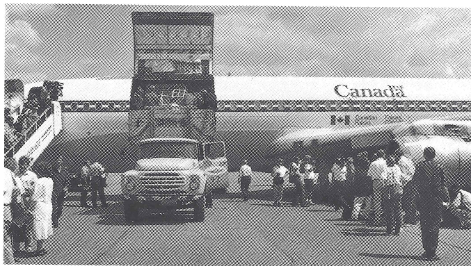
Assistance to Ukraine materialize quickly. Допомога Україні здійснювалася швидко.