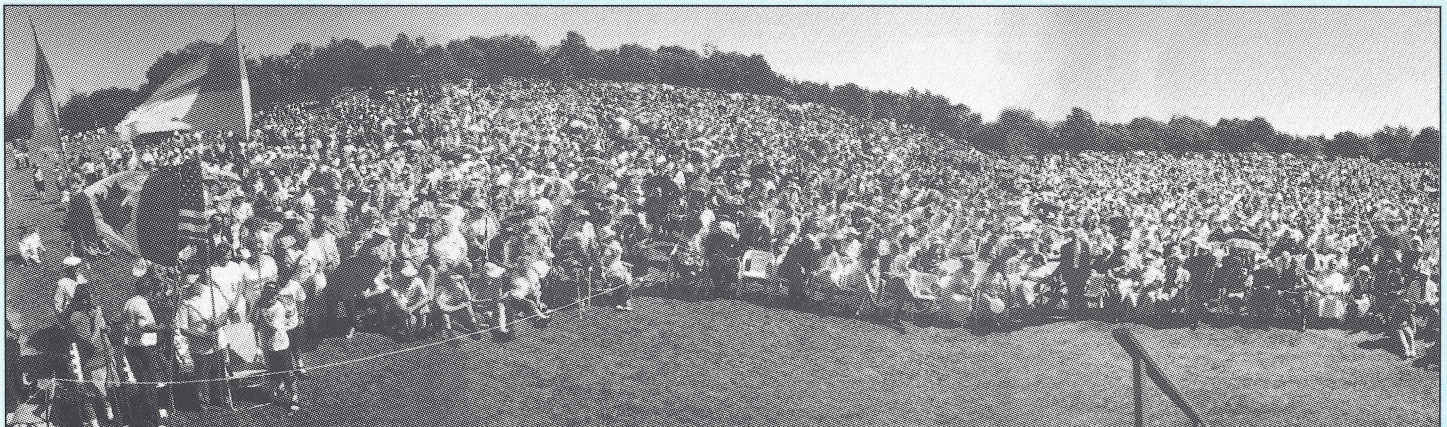
Festivities near Toronto...